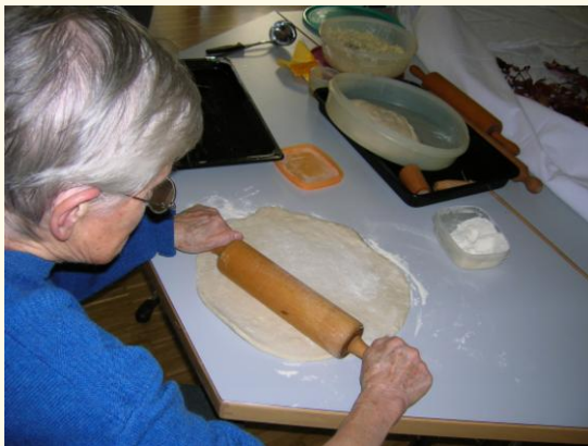
Teig ausrollen – eine vertraute Beschäftigung

In der häuslichen Umgebung der Wohngruppe wird an individuelle Lebensgewohnheiten angeknüpft. Die Bewohner werden in die alltäglichen Aktivitäten einbezogen und erfahren dadurch Kompetenz und Wertschätzung. Die Integration der Wohngruppe mitten in einem „normalen“ Wohnumfeld ermöglicht Quartiersnähe und eine gute Beteiligung von Angehörigen und freiwillig Engagierten, welche die Anknüpfung an die Lebensgeschichten der Bewohner besonders ermöglichen.