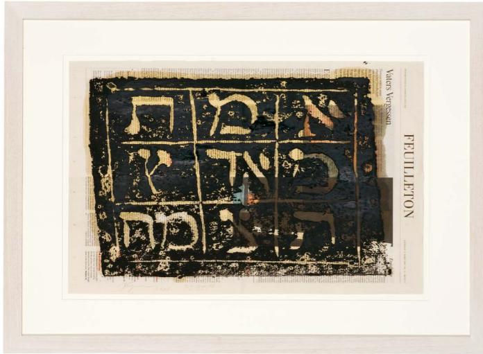
Felix Droese, 2008, Holzdrucke auf Zeitungspapier, 70×50 cm