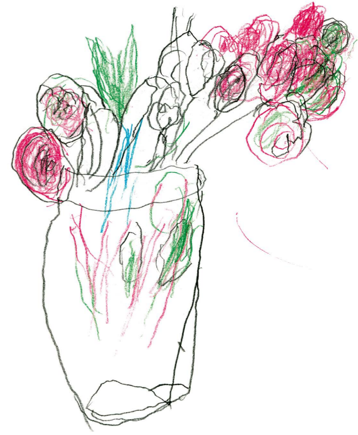
Ida Rodenacker, 2007, Bleistift und Buntstift, 20×30 cm

Rechts: Eberhard Warns, 2005, Acryl auf Leinwand, 140×100 cm