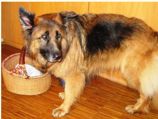
Die Schäferhündin Ayla