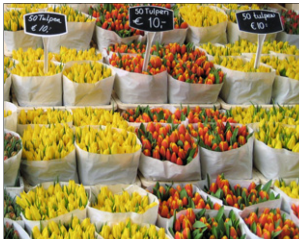
Tulpenverkauf auf dem Blumenmarkt in Amsterdam: Farbenpracht in Hülle und Fülle.

Johannes Heesters Lied ‚Man müsste Klavier spielen können‘ wird heute noch bei unseren Fingerübungen gespielt. Zum guten Schluss fällt uns auch noch der kleine Heintje mit seinen liebevollen Liedern ›Mama‹ oder ›Oma so lieb, Oma so nett‹ ein. Ein Opernfan erwähnt die Oper ›Der fliegende Holländer‹ von Richard Wagner.