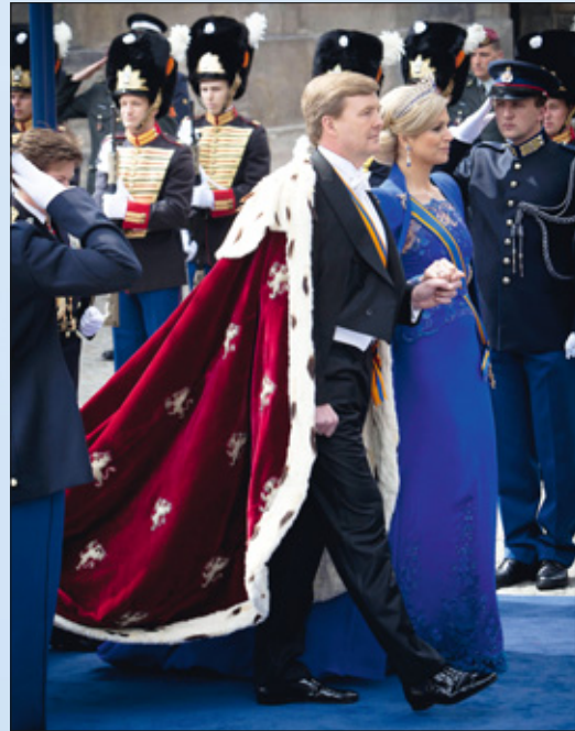
Das niederländische Königspaar Willem-Alexander und Máxima auf dem Weg zur Inauguration, 2013.

Amsterdam, Hauptstadt der Niederlande. »Die Fahrt auf den Grachten war so schön«, schwärmt eine Dame. Wir betrachten Bilder von den Sehenswürdigkeiten, erinnern uns an Anne Frank, die mit ihrer Familie nach Holland auswanderte, um der Verfolgung durch die Nationalsozialisten zu entgehen. Alle Gäste