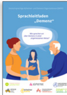
Sprachleitfaden »Demenz« – angemessen über Demenz sprechen