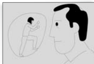
»Durch den Nebel« – jetzt auch auf Türkisch und Russisch