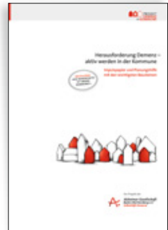
Herausforderung Demenz – aktiv werden in der Kommune. Impulspapier und Planungshilfe