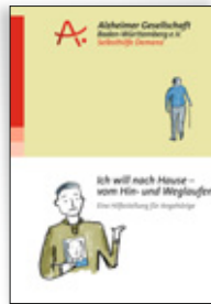
Ich will nach Hause – vom Hin- und Weglaufen. Eine Hilfestellung für Angehörige

Infomaterial bestellen Sie am einfachsten über unsere Website → www.alzheimer-bw.de/infoservice , alternativ auch telefonisch oder per Mail.